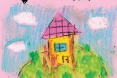
Gefühle an dich in einer Altbauwohnung, Pt. 1

Still hating Goddamn humahrace but im so glad you are a human i love you