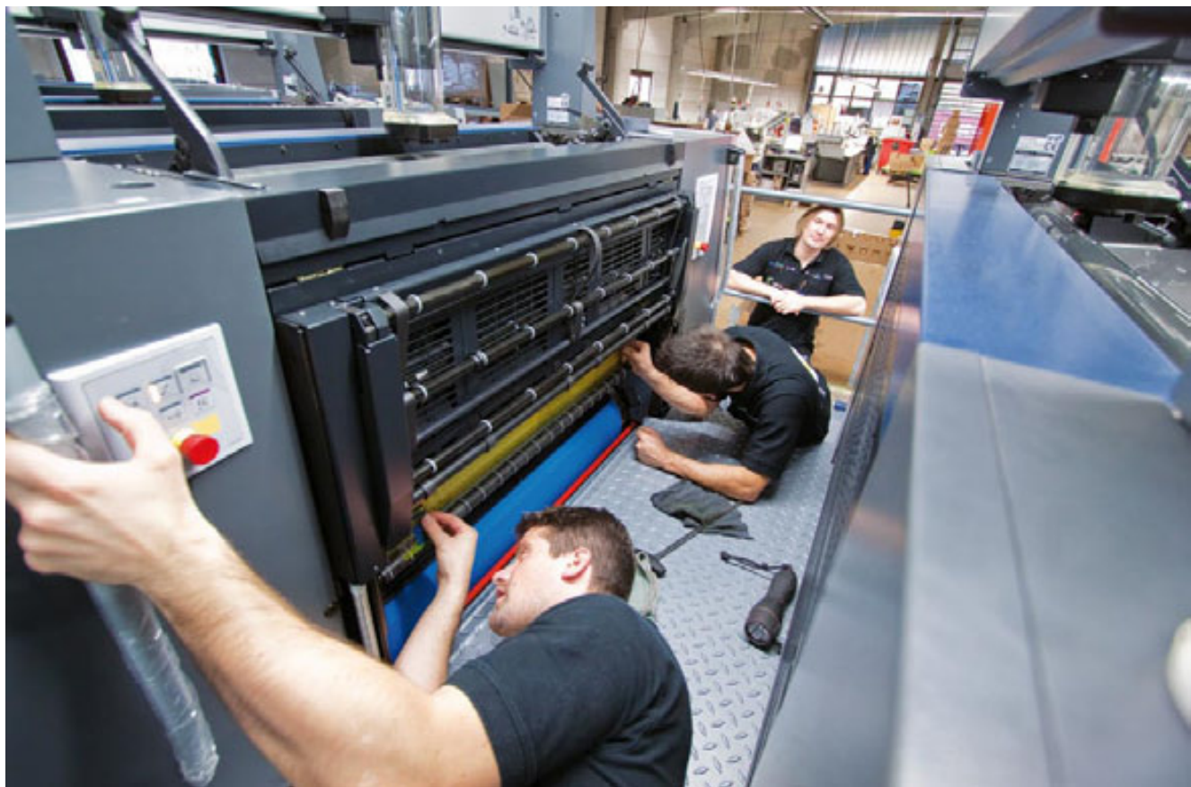
HOCHQUALIFIZIERTE FACHKRÄFTE sorgen für einen reibungslosen Ablauf.

Wendeeinrichtung lassen sich hier Flyer und Broschüren in einem Arbeitsdurchlauf vorder- und rückseitig bedrucken. Bis zu 15 000 Druckbögen lassen sich so in einer Stunde verarbeiten. Durch den Einsatz der neuesten Drucktechnologien können wir noch effizienter, ressourcenschonender und kostengünstiger drucken. Auch sehr hohe Auflagen von Flyern, Falzflyern und Broschüren lassen sich schnell und in höchster Druckqualität produzieren. Die daraus entstehenden Kostenvorteile geben wir gerne an unsere Kunden weiter.