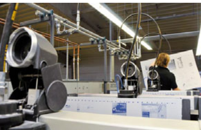
DIE DRUCKPLATTEN für jedes Druckwerk werden manuell eingesetzt.

und die Ware versendet. Verbindet der Kunde die Bestellung mit dem Expressversand, bekommt er seine eiligen Drucksachen am nächsten Werktag zugestellt. Für kurzfristige Werbeaktionen oder laufende Messen, auf denen dem Aussteller die Flyer am Messestand ausgehen, ist die Schnelligkeit der Bestellabwicklung nicht mehr zu toppen.