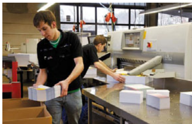
JEDES DRUCKPRODUKT wird nach dem Endbeschnitt sofort verpackt und verschickt.