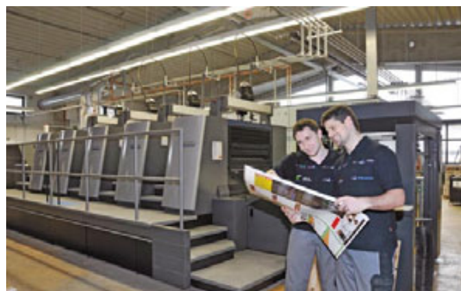
KONTROLLE DER DRUCKBÖGEN beim Offsetdruck für eine konstant gute Qualität.

schleunigt sich damit um einige Tage und der Kunde bekommt seine Drucksachen bei Standardversand innerhalb von drei Werktagen ausgeliefert. Natürlich können bei uns viele Drucksachenarten auch über die Option „Blitzdruck“ bestellt werden. Ist der Bestellvorgang bis acht Uhr morgens abgeschlossen, wird am gleichen Werktag produziert