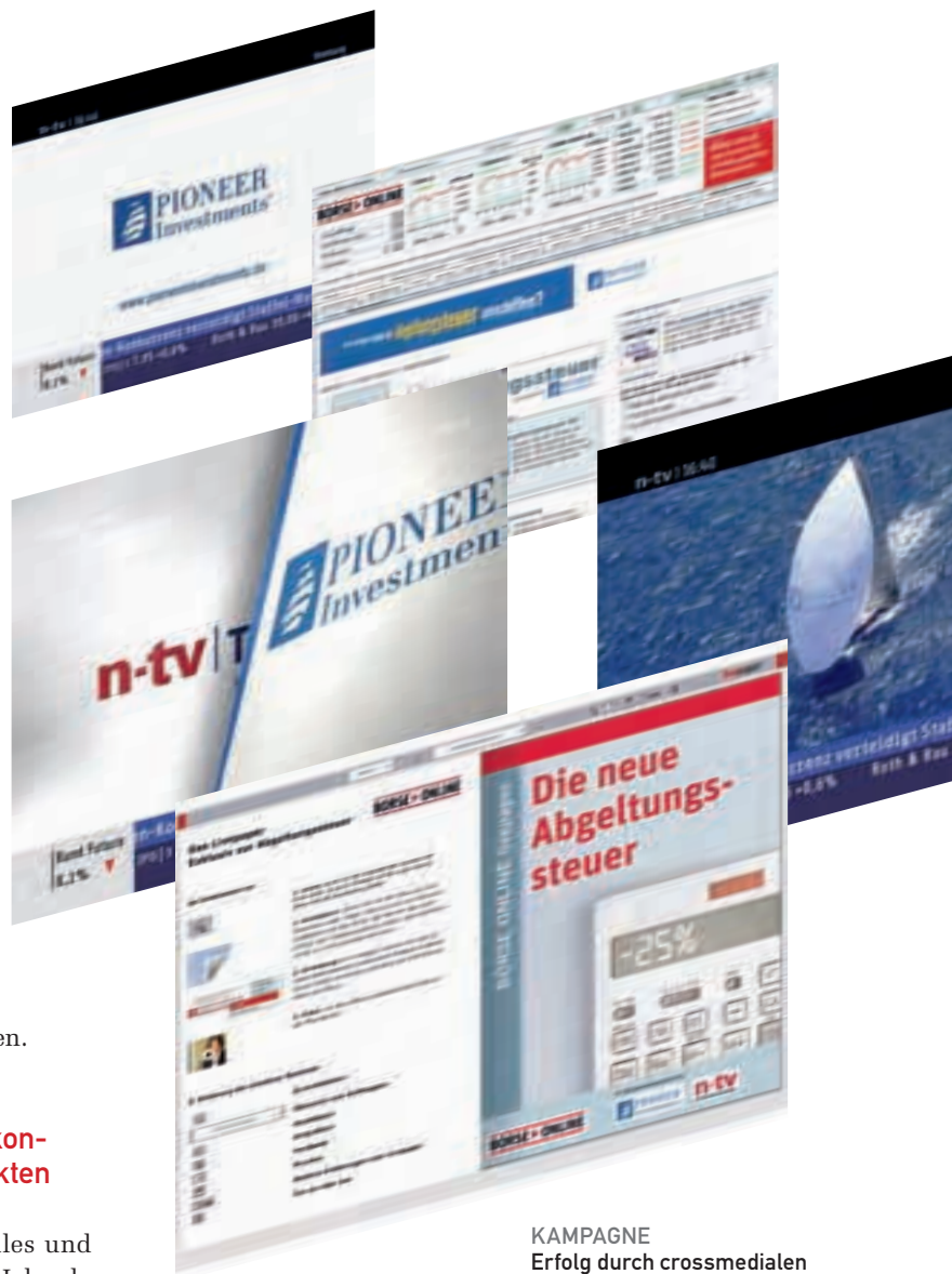
KAMPAGNE Erfolg durch crossmedialen Ansatz.

Unsere Partnerschaft mit G+J Media Sales und IP Deutschland geht bereits in das dritte Jahr, da uns die Ergebnisse der Werbewirkungsforschung der vergangenen Kampagnen mehr als überzeugt haben. So haben die Analysen der bei G+J und IP ausgelieferten Kontakte der Vorjahreskampagne gezeigt, dass der crossmediale Ansatz die Wirkung deutlich verstärkt hat und Image-Parameter wie Werbe-Awareness, Sympathie und Kaufbereitschaft deutlich gesteigert werden konnten. Besonders deutlich zeigen sich die crossmedialen Effekte bei der Veränderung der Markensympathie. Hier konnte bei den Mixkontakten – also TV/Print/Online – eine Steigerung von 19 Prozent im dritten Quartal 2007 auf 24 Prozent im vierten Quartal 2007 gemessen werden, während bei den Kontakten ohne crossmediale Effekte lediglich ein Anstieg von neun auf elf Prozent erfolgte. Auch die Markenbekanntheit konnte durch die Mixkontakte von 47 auf 58 Prozent gesteigert werden, während sie ohne Crossmedia-Kontakte lediglich von 29 auf 35 Prozent anwuchs.